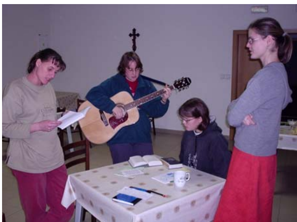
Nově se připravující dobrovolníci jsou hudebně nadaní.

Svoji službu dobrovolníci ukončili v srpnu 2003 na Celostátním setkání animátorů, kde pomáhali v pracovním týmu zajišťujícím celé setkání.